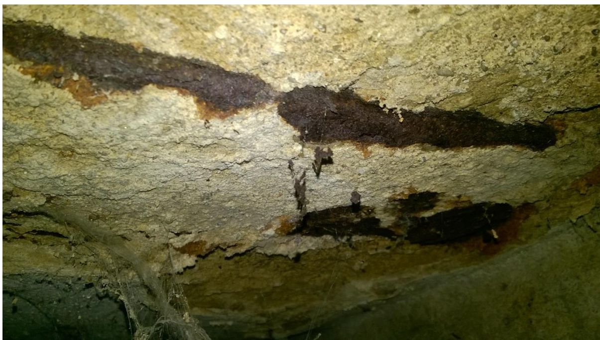
fot. nr 1 korozja powodująca rozwarstwienie dolnych pól belek stropowych

Zwiększony poziom wilgoci w części piwnic przyległych do ściany podłużnej zewnętrznej i poprzecznej ( pralnia) spowodował korozję elementów stalowych stropów piwnic oraz korozję nadproży stalowych.